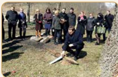
Patikrintas velykinių margučių stiprumas ir manevringumas