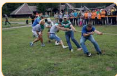
Lietuvos veterinarų sąskrydyje – ištvermės išbandymas