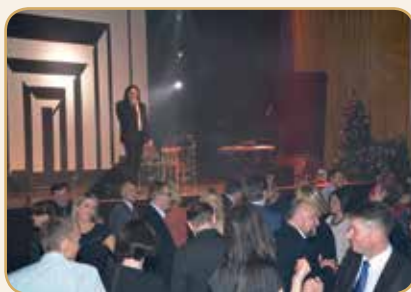
Kalėdinė VMVT fiesta Kėdainių „Vikondos“ klube