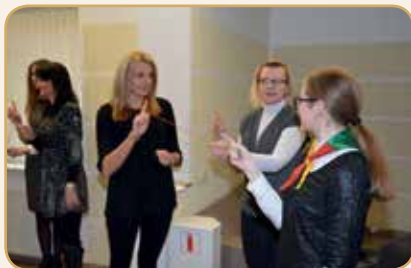
Vertiname, mylime ir švenčiame laisvę Kovo 11-ąją

VMVT komanda palaiko pilietines ir socialines iniciatyvas, o kolegiškus santykius stiprina įvairiuose renginiuose