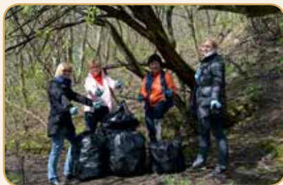
Ne pirmus metus aktyviai dalyvaujame akcijoje „Darom“