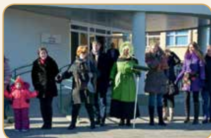
Užgavėnių blynai buvo karšti ir sotūs, raganaitytės – padūkusios, o pokalbiai – iš širdies