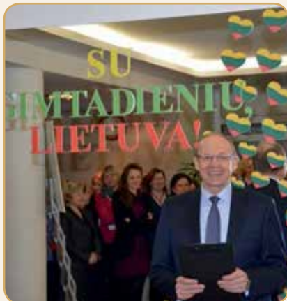
Vasario 16-ąją sveikinome Lietuvą su gimtadieniu