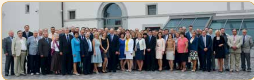
VMVT 15 metų jubiliejaus paminėjimas Valdovų rūmuose