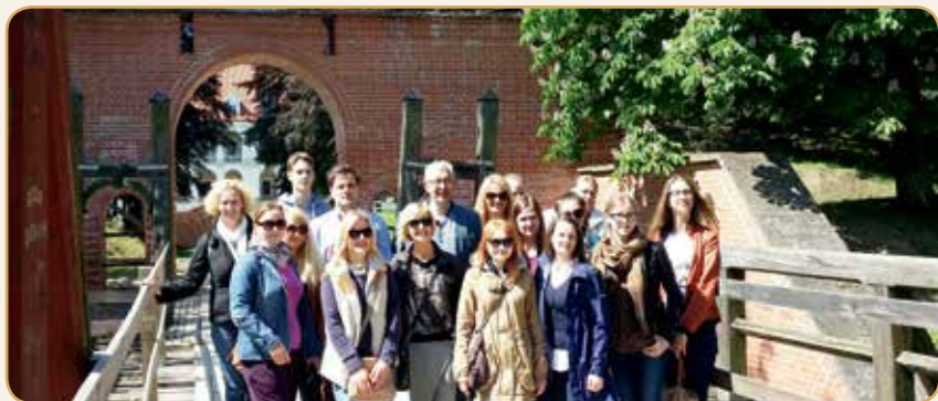
Šeštadienio išvyka su kolegomis į Biržus